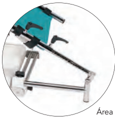
Área perineal libre