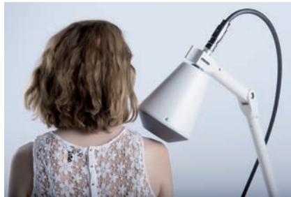
HELMO10 Equipo de microondas con aplicador circular

Este equipo está provisto de dos sistemas de seguridad electrónicos, uno por SOFTWARE y otro por HARDWARE, para evitar potencias de salida no deseadas que se pudieran producir por los referidos cambios bruscos de tensión en la red o por interferencias procedentes de otros equipos que trabajen a su alrededor. Todo ello ofrece importante seguridad.