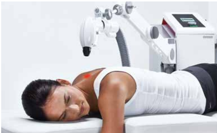
Método de tratamiento estático

2 métodos de tratamiento: estático y manos libres o dinámico y manual