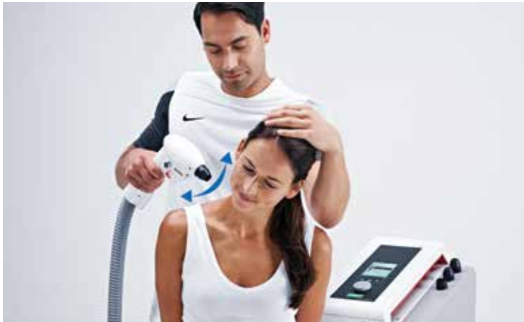
Método de tratamiento dinámico

EL GYMNA CRYOFLOW ICE-CT ESTÁ EQUIPADO CON SOLUCIONES INTELIGENTES PARA SU COMODIDAD: